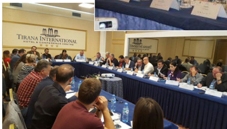
Nga workshopi "Një hap më tej në Planifikimin për Emergjencat"